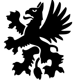
ESA OJALA 1980