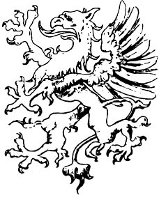
HUGO SIMBERG 1800